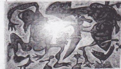
La Pura Realidad.