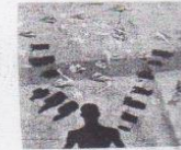
Ganadora de la categoría Pintura.

No era pensable que la tura, la categoría por excelencia en nuestro país, se haya visto tan deficiente. La Bienal Cándido Bidó le ha devuelto cartas de nobleza. En el extranjero, oráculos de la crítica llegaron más lejos, decretando la muerte de la pintura, la suerte del asesinato se pasó a resurrección! Esperamos, después de estos reconocimientos en Bonao, los pintores sientan mejor. Y debemos exigir que varias pinturas más de muy alta calidad.