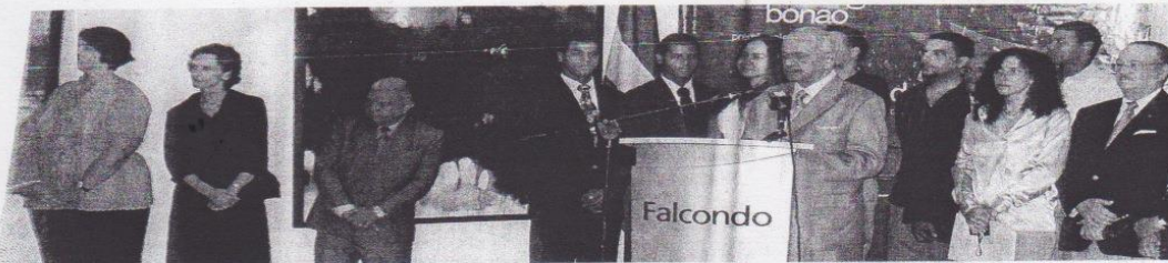
Fuera de la categoría de Pintura -con decenas de cuadros notables-, solamente había dos instalaciones. En la foto, parte de los asistentes a la inauguración de la Bienal.