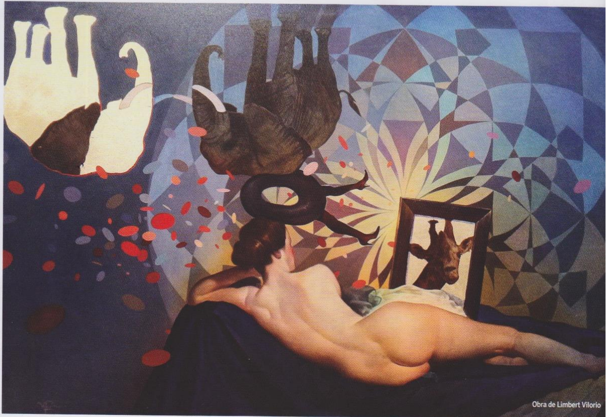
Obra de Limbert Vilorio

{POR LUCY GARCÍA | FOTOS FUENTE EXTERNA | FOTO OBRA RAQUEL PAIEWONSKY www.grayareasymposium.org/blog/5989 }