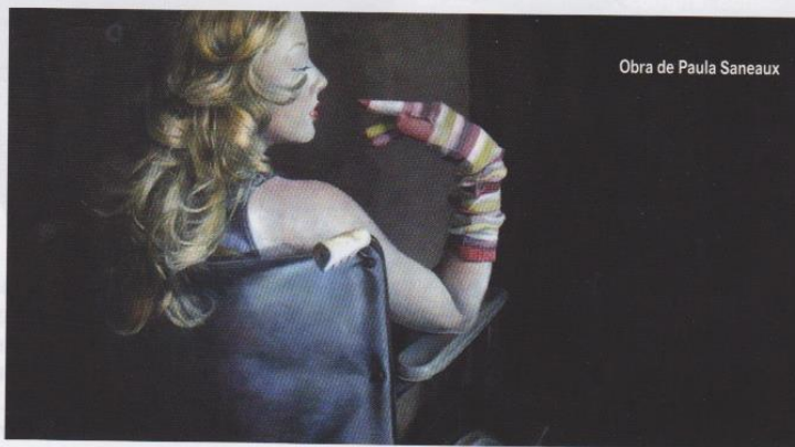
Obra de Paula Saneaux

Una de las recomendaciones más importantes que hago a todo amante del arte, es que trate de informarse sobre qué está pasando en el mundo del arte. Tenemos una ventana abierta que es el internet donde podemos